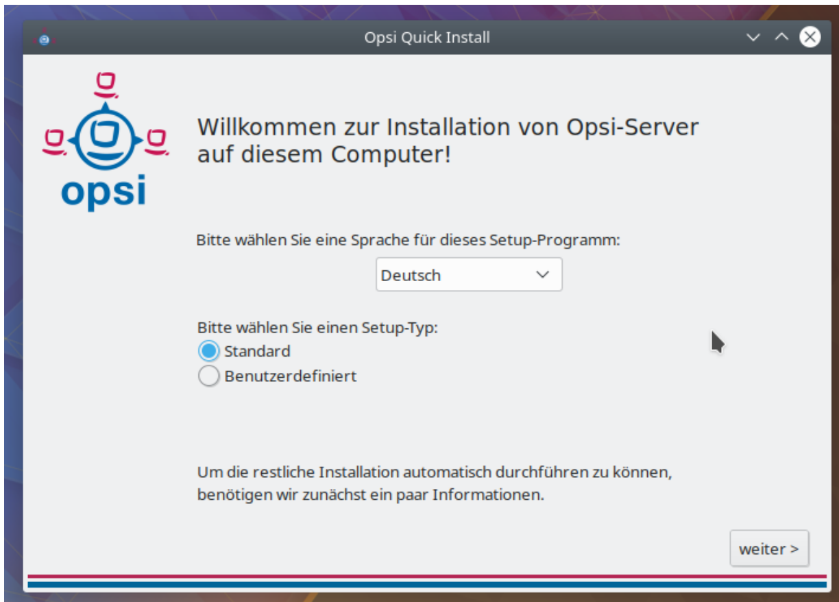
Figure 1. Sprache und Art der Installation

Bei der benutzerdefinierten Installation können Sie detailliertere Einstellungen vornehmen.