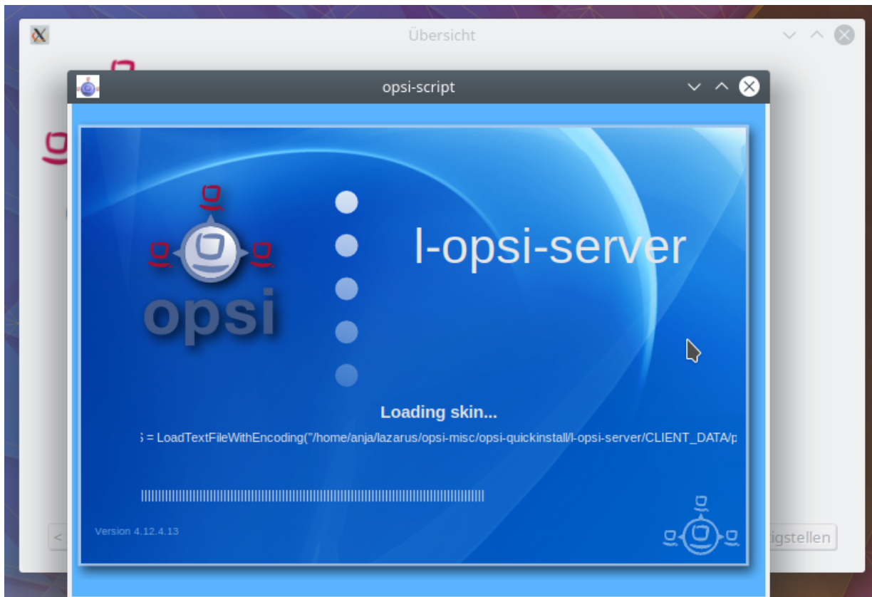
Figure 3. Installation

korrekt ist, klicken Sie auf "fertigstellen", geben Sie Ihr Passwort ein und klicken Sie erneut auf "fertigstellen". Dann beginnt die Installation des opsi-server.