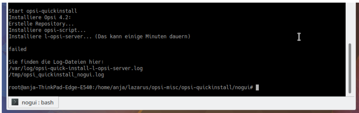
Figure 5. Ergebnis

Die Installation des opsi-server kann einige Minuten dauern. Am Ende zeigt Ihnen QuickInstall an, ob sie erfolgreich war.